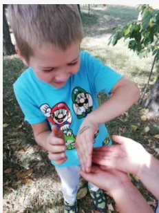
Szabadon, a természettel barátságban

Szeptembertől heti rendszerességgel csütörtök délutánonként lovagoltunk. Minden gyermek kortól, mérettől függetlenül nagy boldogan felült a lóra. Bátran megsimogatták, néhányan meg is etették.