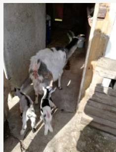
Egy napos kiskecskék