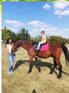
Gubanc mindenki kedvence