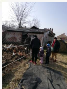
Etetjük a lovakat, tyúkokat