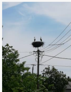
Először a hím gólya érkezik a fészekbe, ő rendezgeti a fészket, várja a párját

Az óvoda hatalmas udvarán találtunk már gyíkot, sünit, békát. Megbeszéltük, hogy ezek védettek, és ezért nem bántjuk őket.