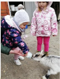
Egy hónapos kiskecskék